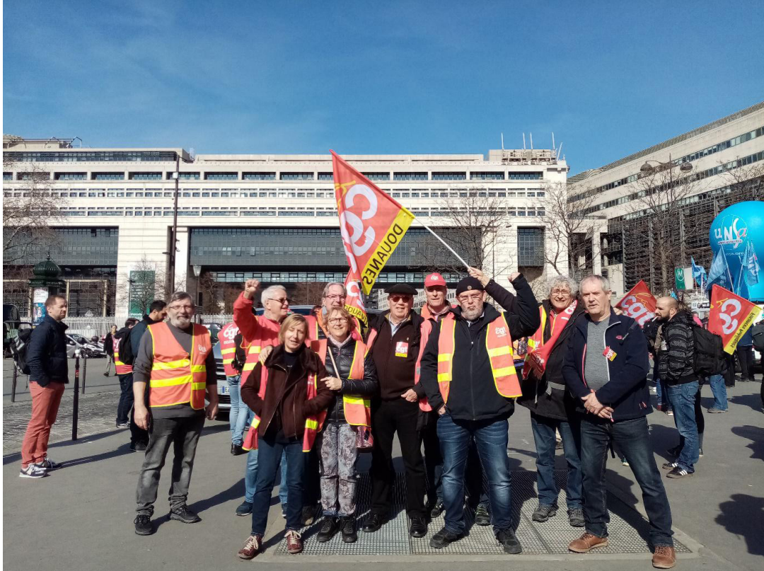
Action des douaniers le 10 mars 2022 devant Bercy

Les Douaniers, fiers de leur administration « singulière » composée de 17 000 agents, ne se résoudront jamais à ce que celle-ci devienne résiduelle.